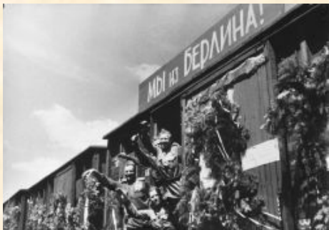
Советские солдаты и эшелон «Мы из Берлина!»

Основное значение Великой Отечественной войны состояло в том, что она окончательно сломила немецкую армию, не давая Гитлеру возможности дальше продолжать свою борьбу за мировое господство. Война стала переломным моментом в ходе Второй Мировой и, фактически, ее завершением.