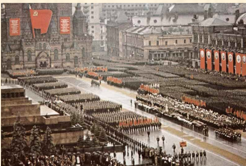
Парад победы 1945 года

Но, несмотря на то, что СССР находился в глубоком кризисе, страна превратилась в сверхдержаву, резко возросло ее политическое влияние на мировой арене, Союз стал одним из самых крупных и влиятельных государств, наравне с США и Великобританией.