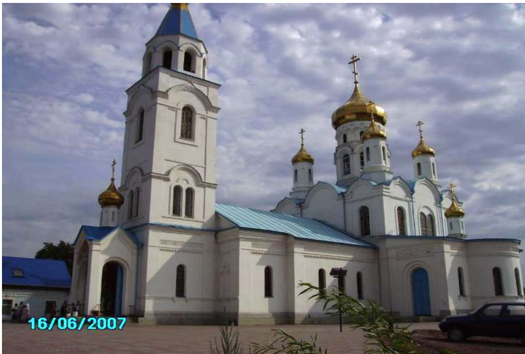
а на Пролетарке находится покровский молельный дом.